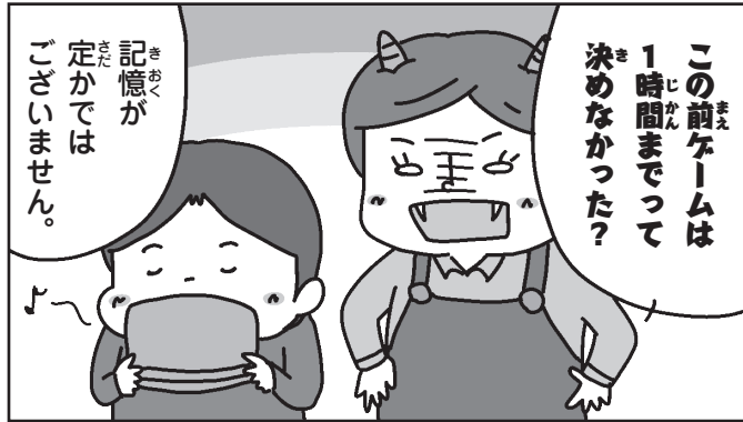
[例] 「記憶が定かではない」とごまかした。