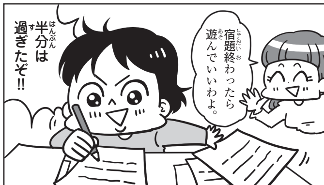
[例] 宿題の大半は片付いた。