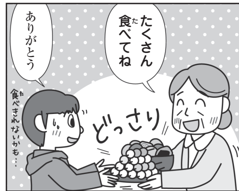
[例] 子どもにお菓子とお団子をあげる。