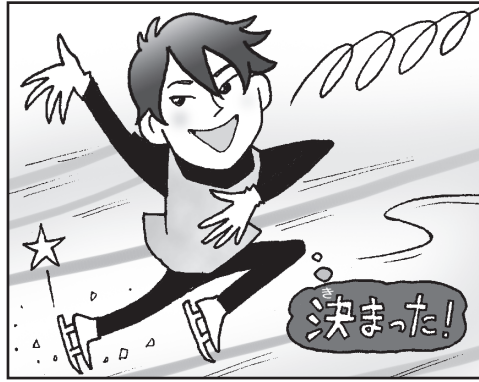
[例] 四回転ジャンプを跳ぶ。