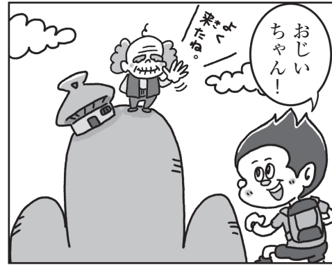
[例] 山の上に住むおじいさんに会いに行く。