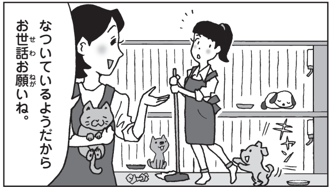
[例] 期せずして担当することになった。